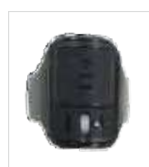
PTT inalámbrico de dedo