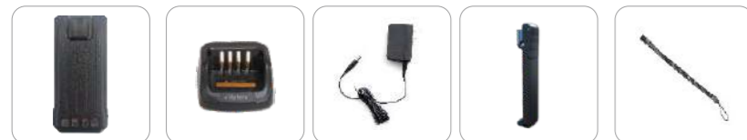
Batería de Li-ion 1500 mAh (Ap586) Cargador rápido MUC (Ap586) Adaptador de energía 12 V/1 A (Ap586) Clip para el cinturón Correa