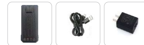
Batería de Li-ion 2000 mAh (Ap586) Cable Tipo C (Ap586) Adaptador de energía (USB) (AP586)