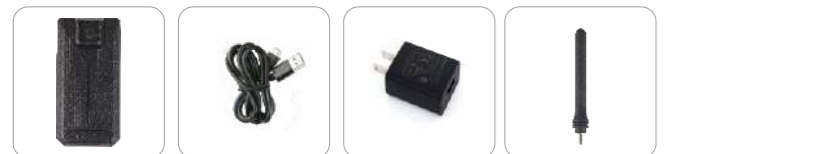
Batería de Li-polímero 4000 mAh (Ap516) Cable Tipo C (Ap516) Adaptador de energía (USB) (Ap516) Antena